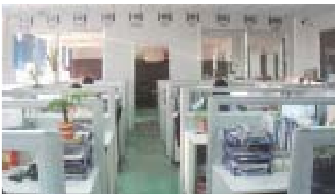
3.6 MM HFOV 76°