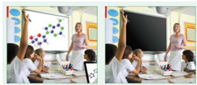
Masquage de l'image désactivé consommation 100%

Gardez le contrôle de vos leçons avec la fonction AV Eco mute. Dirigez l'attention de votre classe loin de l'écran par masquage de l'image lorsqu'elle n'est plus nécessaire. Cela réduit instantanément la consommation d'énergie de 70%.